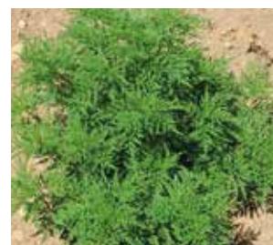
Stade végétatif juin-juillet