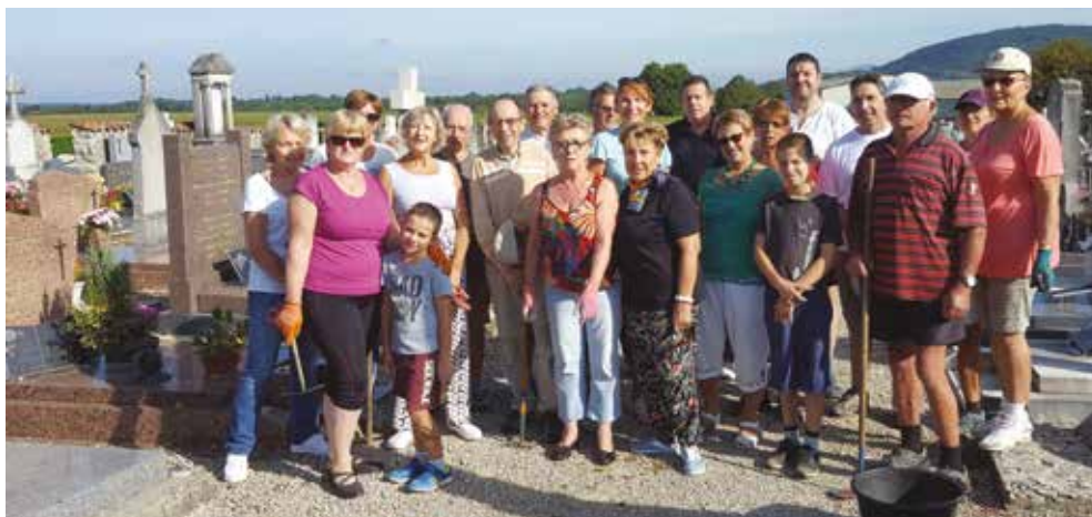
• Les volontaires de l'édition 2019 du désherbage

Rendez-vous au cimetière samedi 12 septembre 2020 à 10h