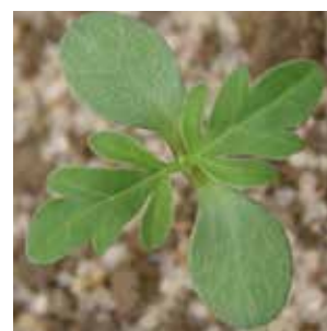
Stade plantule avril-mai