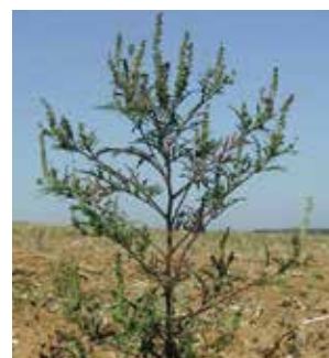
Stade floraison août-octobre