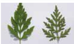
• feuille d'ambrosie (dessous-dessous)