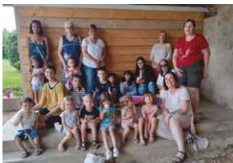
•Après-midi contes le mercredi 21 juin 2023