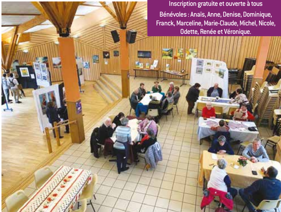
•Exposition Peintres en Dombes les 1 er et 2 Avril 2023