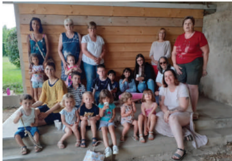
•Après-midi contes le mercredi 21 juin 2023