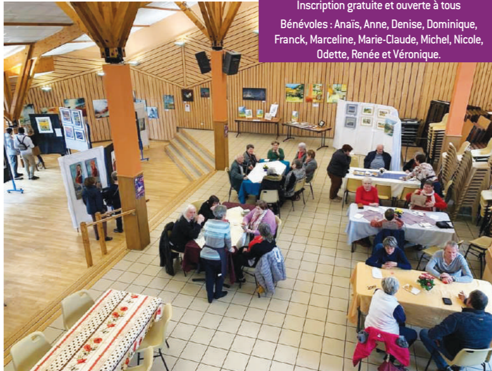
•Exposition Peintres en Dombes les 1 er et 2 Avril 2023